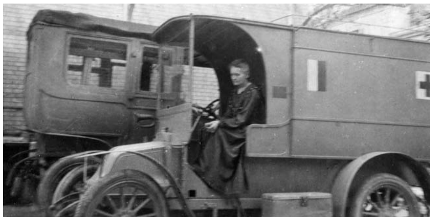
Figura 7. Marie Curie conduint una de les unitats radiològiques anomenades petites curies que va muntar per atendre els ferits de la Primera Guerra Mundial.

ball humanitari. En primer lloc, seguint la crida del Govern francès, que demana or i diners als ciutadans, vol entregar les seves poques joies i també les medalles i condecoracions que havia rebut; el funcionari que l'atén, però, només accepta les joies i refusa les distincions científiques. També fa convertir a francs les corones sueques corresponents al Premi Nobel de Química, que encara eren en un banc suec, i les repatria a França per entregar aquests diners a «la seva segona pàtria».