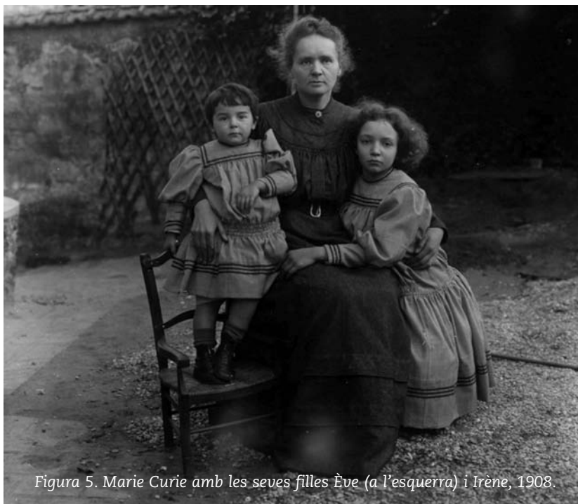
Figura 5. Marie Curie amb les seves filles Ève (a l'esquerra) i Irène, 1908.

família (fig. 5). La Universitat de la Sorbona li ofereix una pensió de viduïtat que ella no accepta al·legant que té trenta-vuit anys i que encara es veu amb moltes forces per treballar. Una nova proposta li permet ocupar de manera extraordinària la plaça de Pierre. Des d'aquesta situació acadèmica, Marie prossegueix les classes de física en el punt on s'havien interromput a causa de l'accident de Pierre. Finalment, l'any 1908, és nomenada catedràtica ordinària, tot esdevenint així la primera dona catedràtica a la Sorbona.