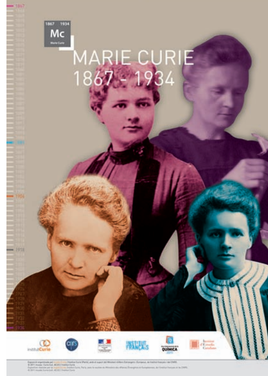
Figura 1. Plafó d'entrada a l'exposició «Marie Curie, 1867-1934», que es pot visitar a l'IEC.

Marie és la més petita de cinc germans, quatre noies i un noi, en el si d'una família de pares professors profundament nacionalistes (fig. 2). Polònia no existeix com a estat independent des del 1795 fins al 1918 i Varsòvia es