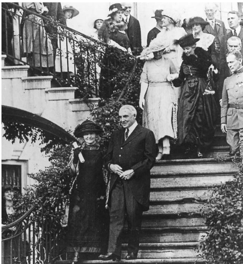
Figura 8. Marie Curie a la Casa Blanca amb el president Warren G. Harding, 20 de maig de 1921.