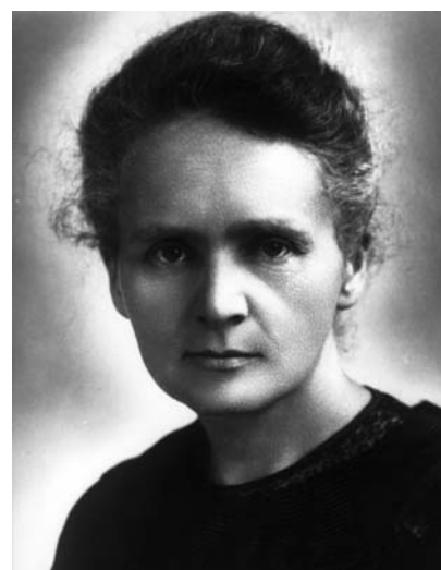
Figura 6. Marie Curie l'any 1913 a la Universitat de Birmingham, on va rebre la distinció de doctora honoris causa.

Durant els anys de la Primera Guerra Mundial (1914-1918), Marie atura la recerca i es dedica al tre-